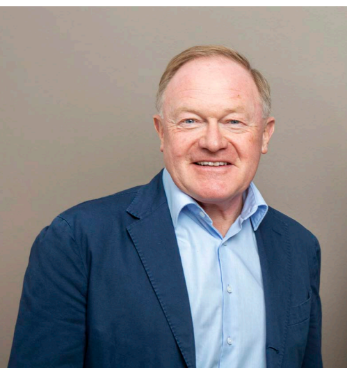
Spitzenkandidat Erich Egger