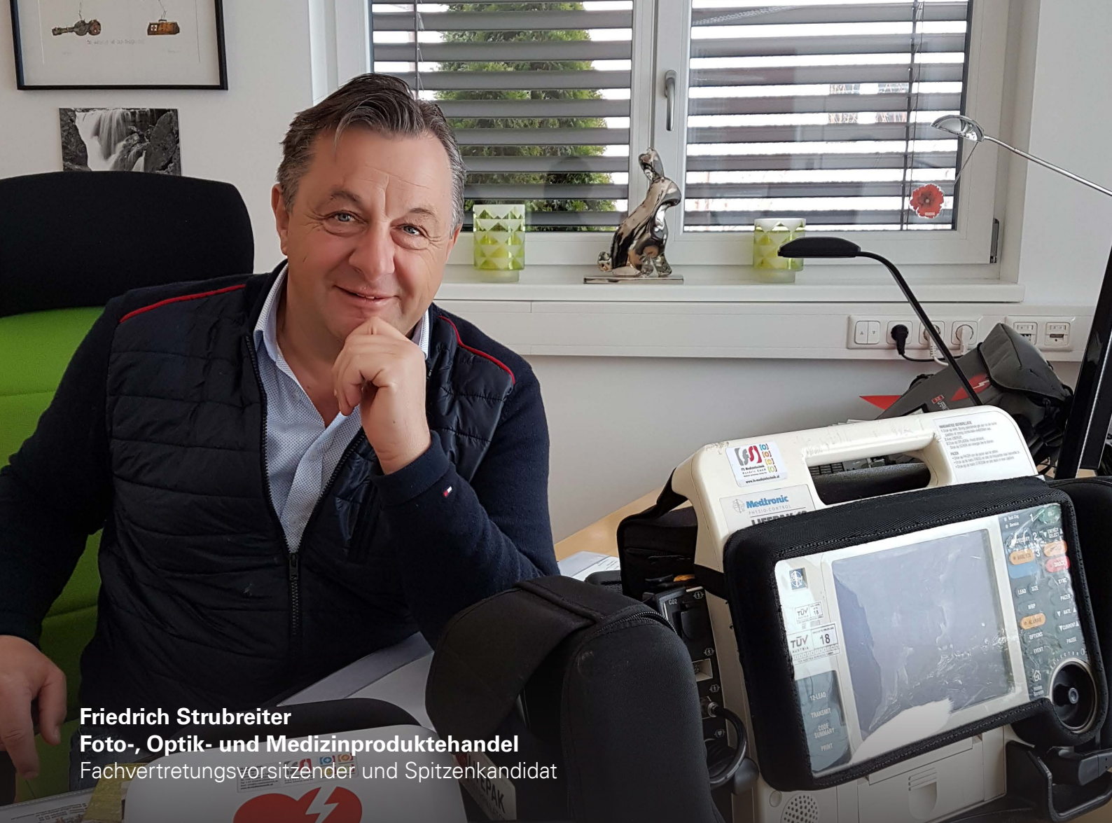
Friedrich Strubreiter Foto-, Optik- und Medizinproduktehandel Fachvertretungsvorsitzender und Spitzenkandidat